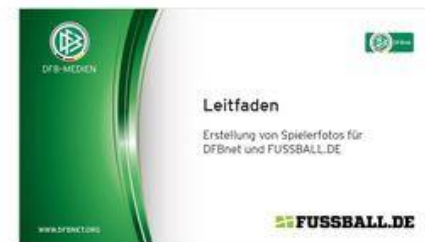
Der Leitfaden zur Fotoerstellung.

» Download: Leitfaden zur Erstellung von Spielerfotos